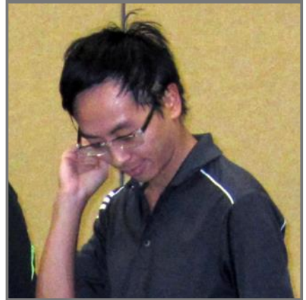
Anh? - Anh!!!!

dafür, dass auch hier die Hinserie noch getoppt werden könnte.